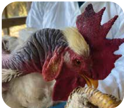
Color azulado de cresta y barbillas.

Es una enfermedad causada por un virus, muy contagiosa, que afecta a las aves domésticas y silvestres y no tiene cura. En forma eventual puede transmitirse a otras especies como los mamíferos y a las personas.