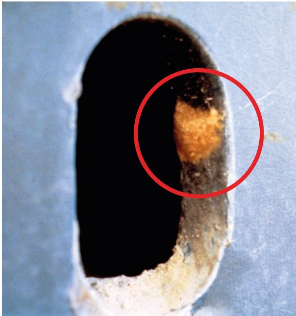
Figura N°1. Masa de huevos de Lymantria dispar en un lugar protegido de la nave.

Las masas de huevos pueden localizarse sobre cualquier superficie. No obstante, los lugares más probables donde pueden estar presentes corresponden a aquellos cercanos a fuentes luminosas y algunos lugares protegidos. Dentro de estos últimos, se encuentran principalmente bajo las estructuras y materiales de diferente naturaleza.