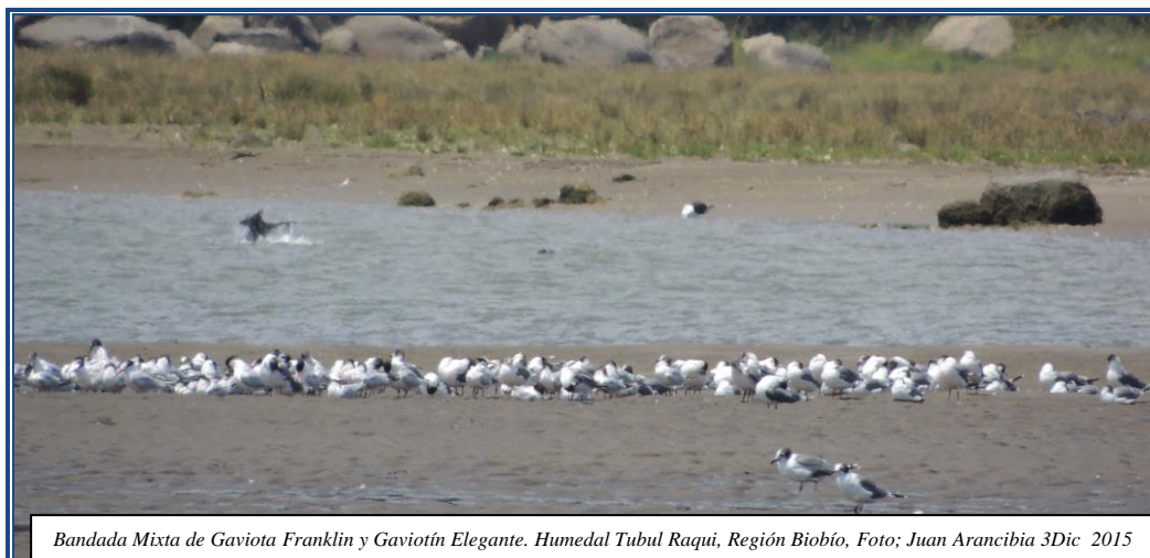
Bandada Mixta de Gaviota Franklin y Gaviotín Elegante. Humedal Tubul Raquí, Región Biobío, Foto; Juan Arancibia 3Dic 2015