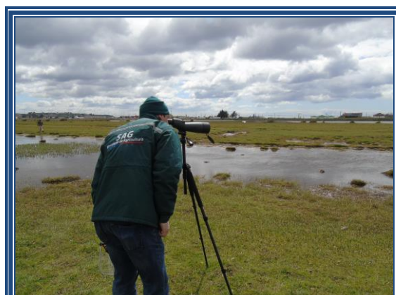
Censo de Aves en Humedal Tres Palos, Punta Arenas. 25 Nov 2015.