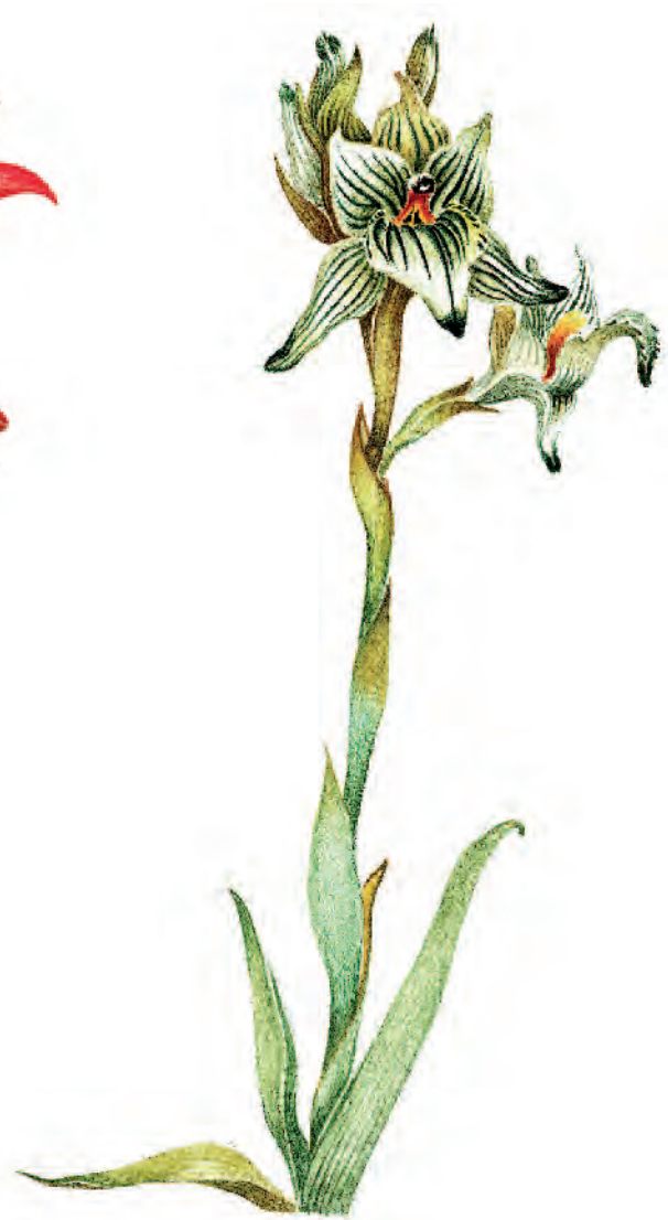
Lengua de Loro

Rhodophiala phycelloides Región de Atacama a Libertador Bernardo O'Higgins