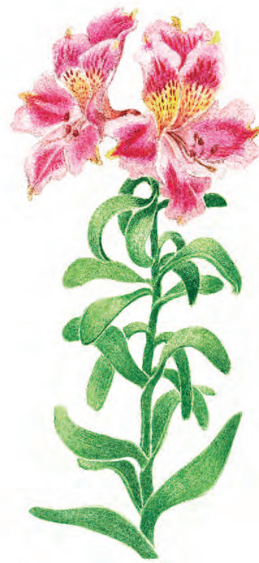
Mariposa de Los Molles

Puya berteroaana Región de Coquimbo a Bio Bio