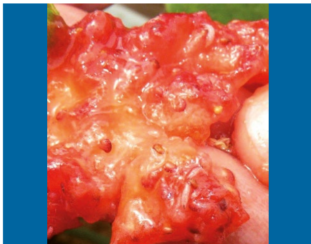
Descomposición de fruta por gran cantidad de larvas en desarrollo.