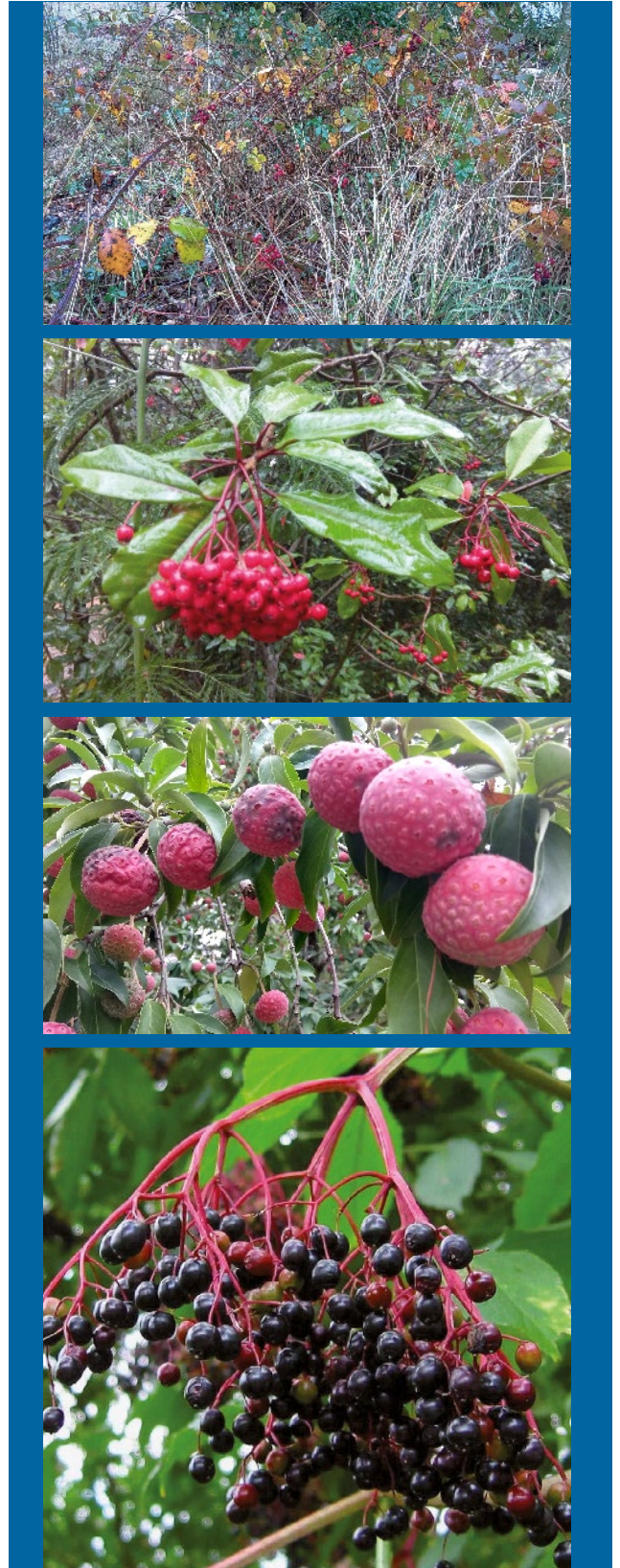
Figura 8: Ejemplo de posibles hospedantes silvestres

Entre los hospedantes no cultivados o silvestres, se citan un sinnúmero de especies. Entre las principales se encuentran la zarzamora , frambuesa silvestre , grosellas , moreras , sauco y varias especies del Género Rubus spp. y Ribes spp.