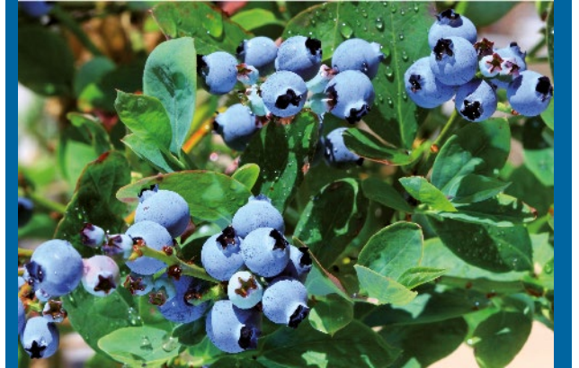
Figura 4. Especie Hospedante: Arándano