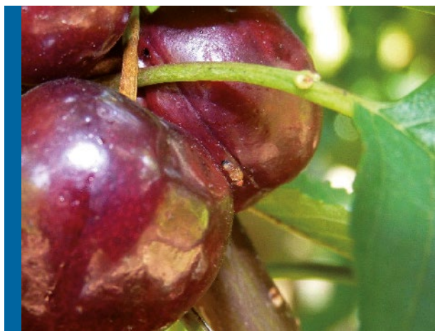
Hembra DS en proceso de oviponer (Daño inicial)