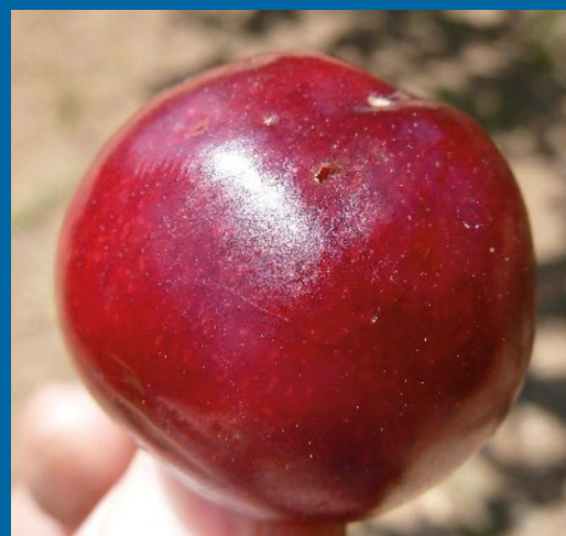
Punteadura por oviposición (Daño inicial)