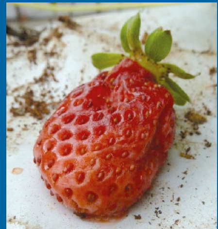
Fruta con daño medio