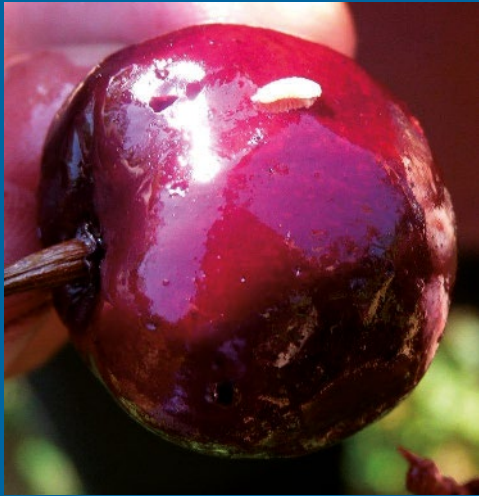
Larvas en fruta (Daño medio)