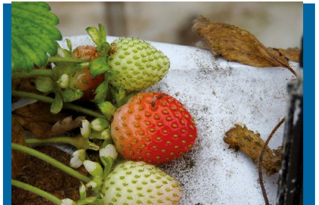
Figura 5. Especie Hospedante: Frutilla