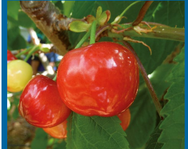
Figura 1. Especie Hospedante: Cereza