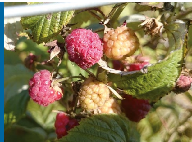
Pardeamiento y necrosis en fruta.