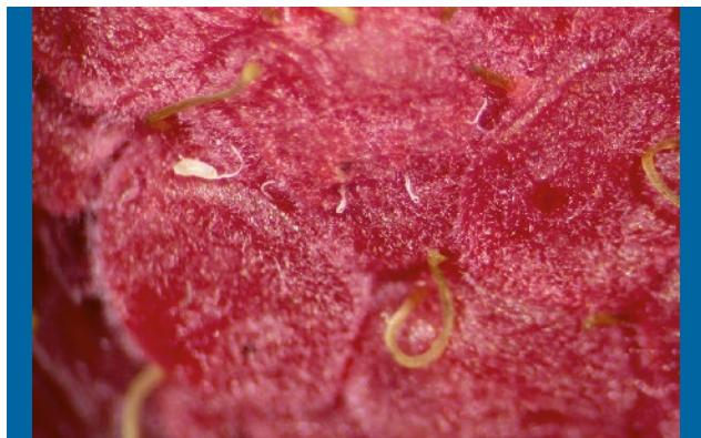
Huevos y espiráculos de DS, además de punteadura