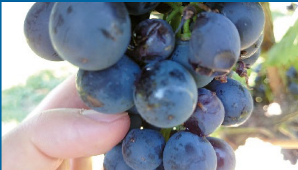
Racimo con bayas en descomposición y pardeamiento por daño de larvas de DS.