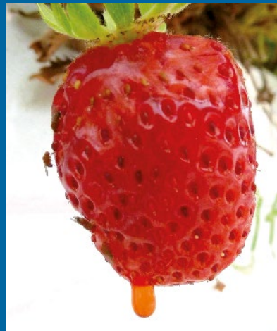
Exudación de jugo en fruta