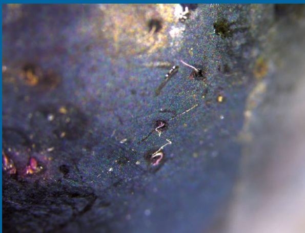
Espiráculos de DS en fruta