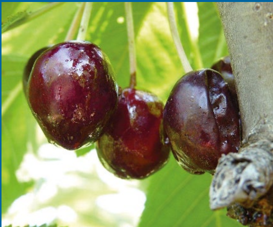
Fruto totalmente dañado en árbol