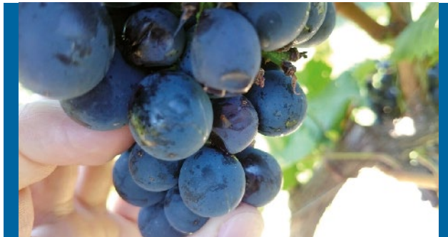
Figura 2. Especie Hospedante: Uva